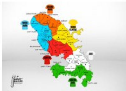
Tableau des districts du diocèse

jeudi 7 décembre 2017, par Michel DEGLISE